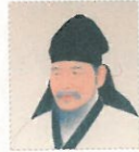
정철 (鄭澈, 1536~1593)

조선 중기의 문신. 문인. 호는 송강(松江). 27세에 장원 급제하여 벼슬길에 나아가 좌의정에까지 이르렀지만, 당파 싸움에 휘말려 유배되기도 하는 등 많은 곡절을 겪었다. 조선 시대 가사 문학을 대표하는 작가로 <관동별곡>, <사미인곡>, <속미인곡>, <성산별곡>을 지었고, 연시조 <훈민가>를 비롯하여 80여 수의 시조를 남겼다. 저서에 <송강집>, <송강가사> 등이 있다.